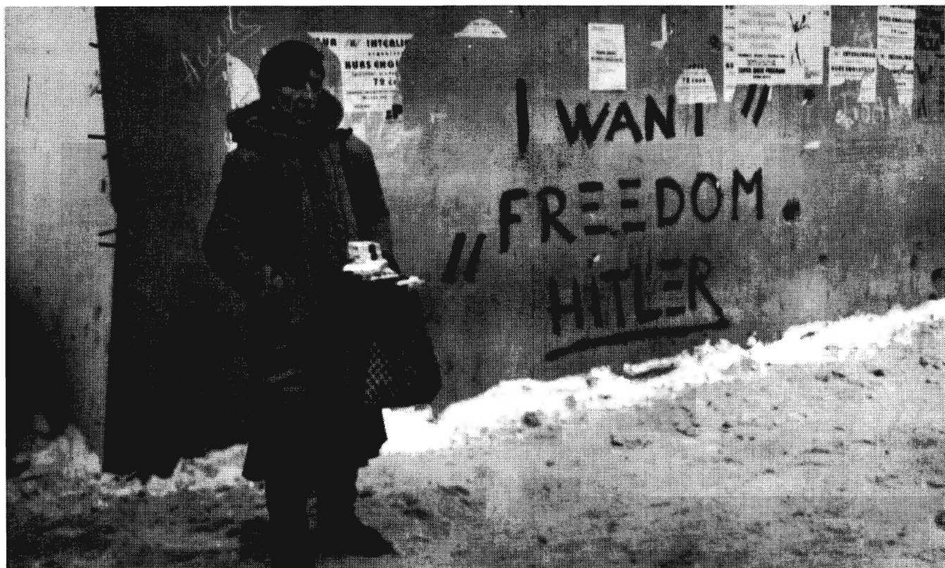
Szarajevó, 1995. január

nem alkalom- vagy véletlenszerű. Szándékos, átfogó és céltudatos volt. Katonai célja volt: sokkal egyszerűbb megtartani egy, a szerb nacionalizmus nevében megszállt területet, ha az összes nem szerb lakost meggyilkolják vagy megfélemlítik. Ahogy Rieff megjegyzi, nem kell a zavargó leigázott lakossággal bajlódni. A másik cél, hogy megakadályozzák egy majdani bosnyák állam vezető rétegének kialakulását. Az ország északi felében, melyet a szerbek oly gyorsan és könnyedén foglaltak el 1992-ben, a tanult férfiakat módszeresen kiirtották, úgyhogy Rieff szerint a terület értelmiségi rétegei teljesen eltűntek. Pol Pot újraértelmezve.