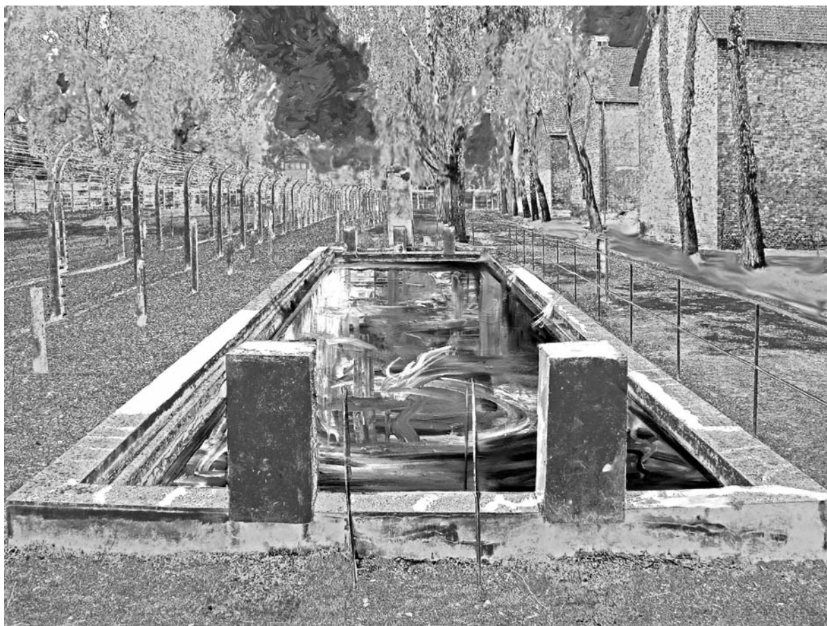
Medence A.-ban III., 2012