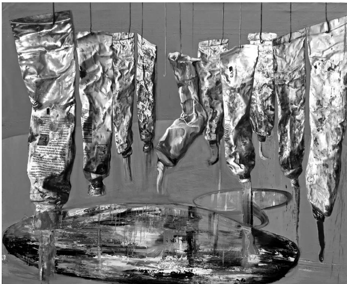
A festészet vége. 2012

vált maga a festészet is. Kedves látogató, téged, aki itt belépsz, az ebben a kettős értelemben gyűrött világ fog fogadni. A világ gyűröttsége több alakban jelenik meg, az első alakot az önarcképek adják. Az 1982-es Önarcképváriációk emelik a gyűrést a saját arc „meggyűrésével” képförmáló elvvé. Az arc az egyik oldalról, majd mindkét oldalról behorpad, ennek következtében megnyúlik, és nehéz ráncok szabdalják keresztül-kasul. A variációk erősen ironikus karakterét a szemüveg és az ing közvetíti, amelyek mindvégig változatlanok. (Ezeknek az önarcképeknek és azok variatív kidolgozásainak a legközelebbi rokonai Francis Bacon portréi és portrétanulmányai.) Ez a formai motívum erősen dinamizálódik, amikor Valkó László a gyűröttséget a sétálásra kezdi el alkalmazni. Ebben az összefüggésben most az 1984-es Kosuth utca című képet szeretném kiemelni. A járda ütött-kopott, erre már időtlen idők óta nem