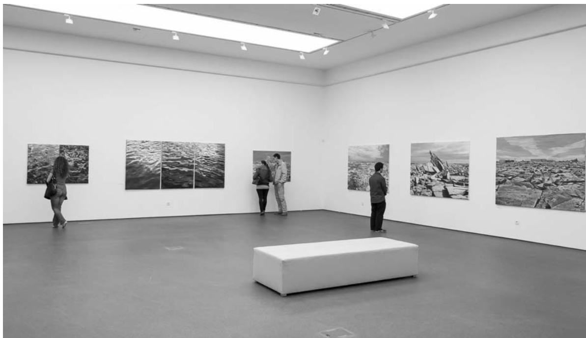
Részlet a kiállításból