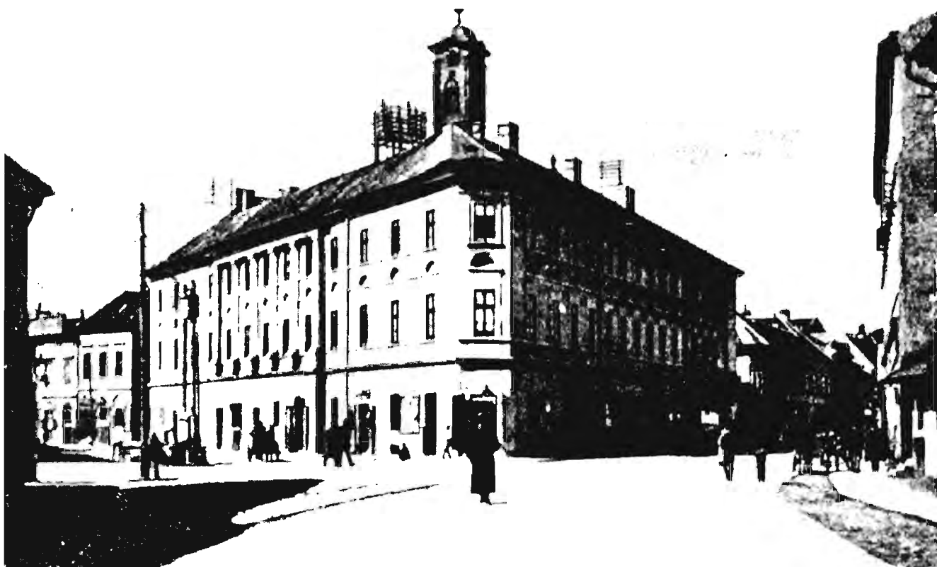
Az aradi zsidó hitközség épülete