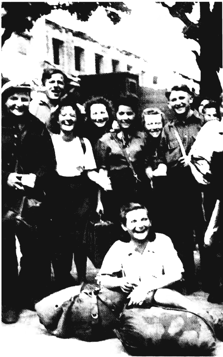
Kielcei fiatalok az IHUD mozgalom keretében Palesztinába tartanak. Budapest, 1945

A zsidó házból 2.30-ra szorítják ki a „ludwikówi” munkások szabadon továbbgyilkoló tömegét, s estére, a góra kalvariai őrdandár harckocsijainak megérkezése után sikerül a rendet helyreállítani. A sebesülteket és túlélőket az est folyamán átszállítják Lódzba. De ekkorra már az egész vajdaságot összevérzik az aznapi események hírei. A wrocław-lublíni vonaton vasutasok, civilek, aktív és szabadságos katonák egyaránt zsidókra vadásznak, s akikre rátalálnak, agyonverik, lelövik, megkövezik, jobbik esetben „csak” félholtra rugdossák... A zsidó kinézetű lengyeleket is. Pogromra készülnek Czesztochowában is, de itt nem ülnek fel a középkori vérvadásokat terjesztő rémmeséknek. Kaliszban is híre megy a gyermekeket henteskampóra akasztó rabbirol szóló rémtörténeteknek, amelyeket csak azok találhatták ki, akik tudták, Hitler hogyan végeztette ki az ellene összeesküvők egy csoportját. Más kisebb városok is megbolydulnak. Mind-mind egy időben: július 4-én.