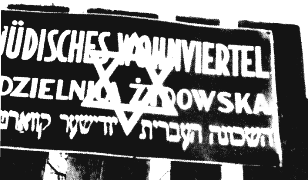
A kielcei gettó bejárata, 1941

lalkozás hosszú távon bizonyára a vidék lakosságának nagy tömegeit emelte volna ki a szegény sorból, s Kielcének is lehetősége lett volna a fejlettebb, módosabb lengyel települések sorába emelkedni. A háború kirobbanása, a német megszállás más módon hozott gyökeres változásokat a város életében, s ezek legtragikusabban Kielce zsidó polgárait érintették.