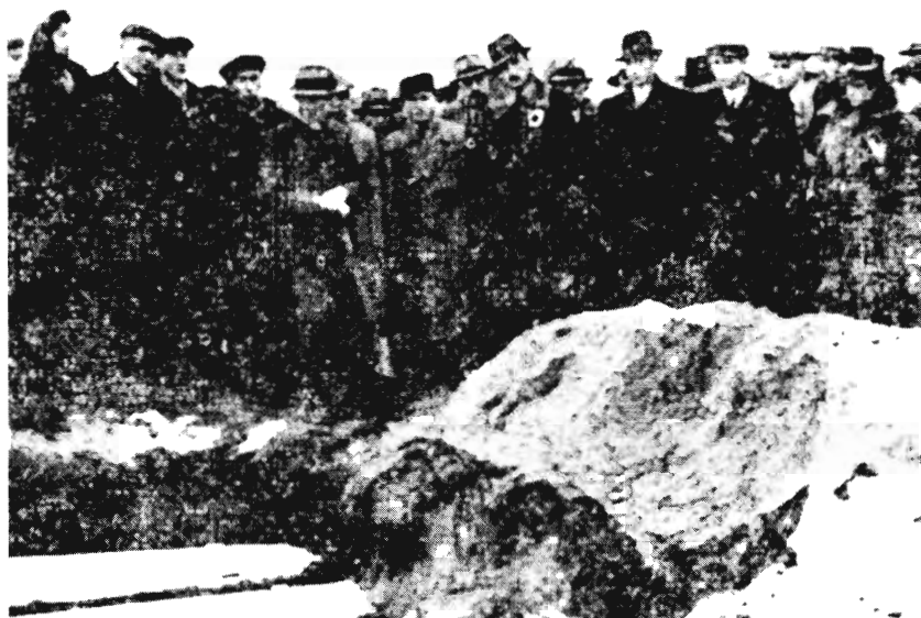
A kielcei pogrom 42 áldozatának temetése, 1946

A kielcei pogrom 1946 után apránként a tabuté- mák közé került. Harmincöt évig nem vagy alig esett szó róla. A csendet a Szolidaritás időszak törte meg. Krystyna Kersten Kielce – 1946. július 4. című cikke, jóllehet a szükségállapot bevezetése előtt pár nappal jelent meg a Szolidaritás Hetilapban , ha visszhangot már nem válthatott is ki, felkeltet-