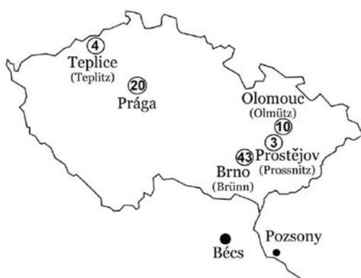
Magyar (budapesti) futballisták Csehországban 1919 és 1926 között 20