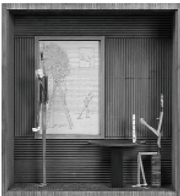
Böröcz András: House of Cards. 2004