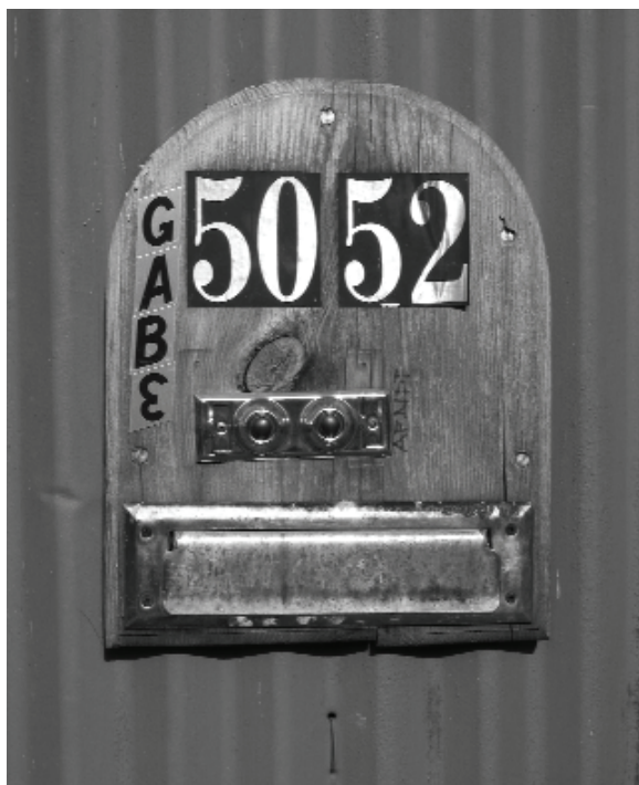
A Böröcz ház bejárata

udvarral. Megérkezésünk után vendéglátónk azonnal elbűszkélkedett a belső udvaron kialakított kis konyhakertjével. Paradicsom, paprika, fűszernövények... Jóságos mosoly ült az arcán, mikor megmutatta a növényeit.