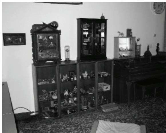
Böröcz András gadget- és nippgyűjteménye