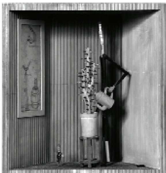
Börcz András: Triage, 2006