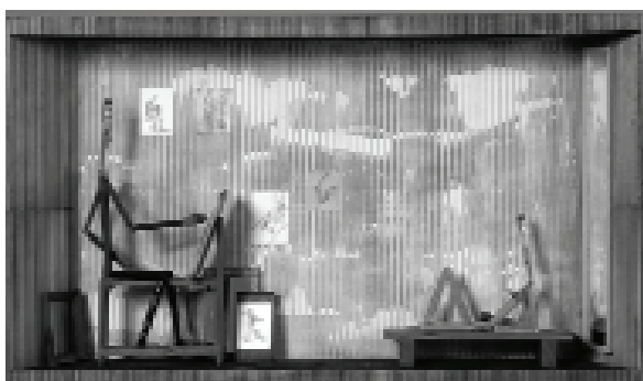
Börcz András: Big Nude, 2006