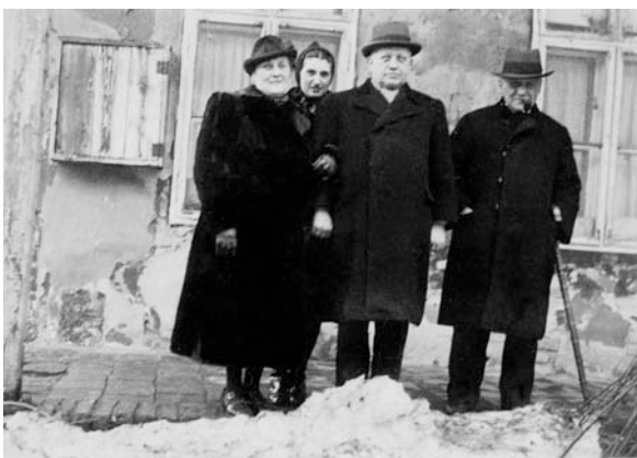
A szerző édesanyja és nagyszülei 1940-ben Újpesten