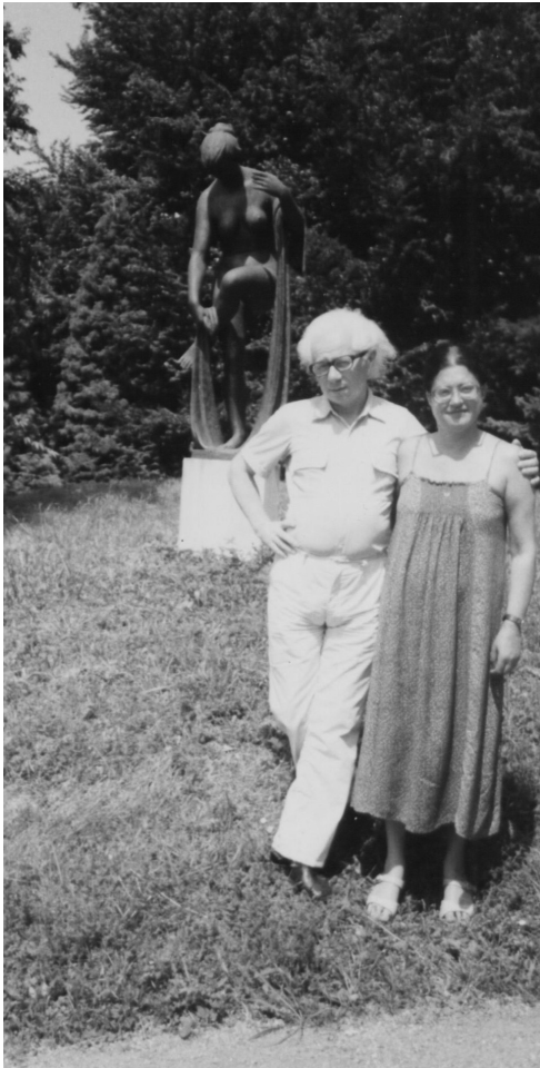
Szigligeti alkotóház 1976