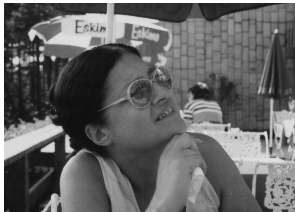
A presszó teraszán