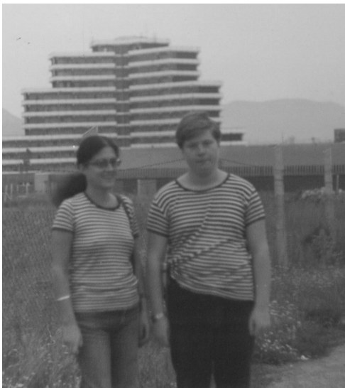
Veszprémtől nem messze anya és fia