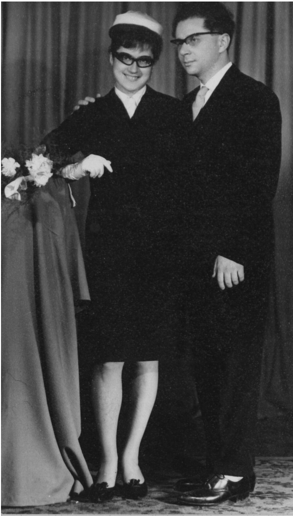
Esküvői kép, 1964