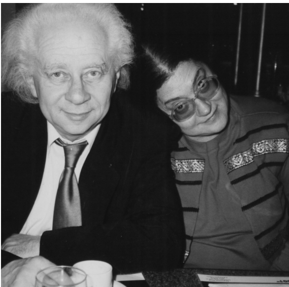
Egy pillanatnyi boldogság