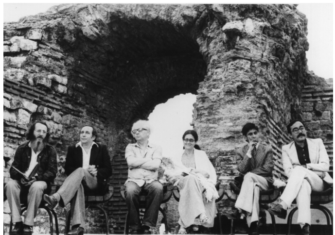
Nemzetközi költőtálkozó Szerbiában