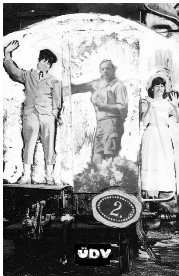
Roskó Gábor munkája

ellenőrizni, hogy pontosan hol is vannak azok, akik a képeslapokat küldték családtagjaiknak. Hát ez volt a nagy félrevezetési hadművelet. A magas rangú tiszt megértette az ördögi tervet, és cinikusan mosolyogva csak annyit mondhatott: „gut!” Ennyi kellett csak, hogy a gépezet beinduljon. A hozzátartozók szeretteik kézírását látva hittek a képeslapok hitelességében, mígnem egyszer csak ezek a lapok is elmaradtak. Ki tudja, hol vannak eme történelmi fontosságú dokumentu-