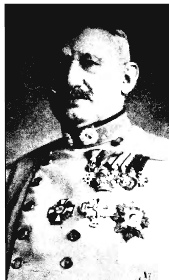
Báró Hazai Samu

Hazai Samu nevéhez honvédelmi minisztersége idején kiadott törvények egész sora fűződik. Így a modern katonai büntető eljárásról szóló, a háború esetére való rendkívüli kormányzati intézkedésekre vonatkozó törvényjavaslatok és a véderőreform törvénybe iktatása – mind az ő érdeme. Mindezért, 1912-ben Ferenc József uralkodó bárói rangra emelte, majd 1916-ban vezérezedessé léptette elő. Érdemei elismerésül számos hazai és külföldi kitüntetést kapott. 1917-ig volt honvédelmi miniszter, amikor az Osztrák–Magyar Monarchia hadseregének utánpótlási főnöke lett. Ugyanakkor a uralkodótól a szegedi 46. gyalogezred tulajdonjogát kapta.