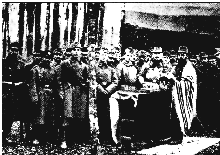
Istentisztelet a 44. gyalogezrednél, az orosz fronton

A magyar emigráns honvédek közt ő volt az első, aki 1851-ben csatlakozott Kubának, az USA által támogatott annexionista felszabadító mozgalmához, a spanyol gyar-