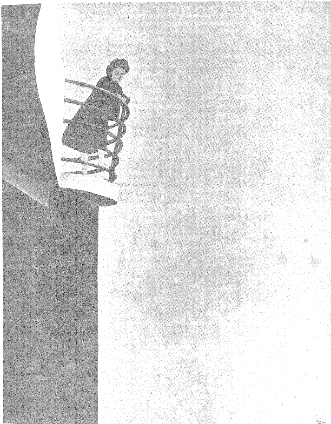
Fehér László: Balkon, 1988