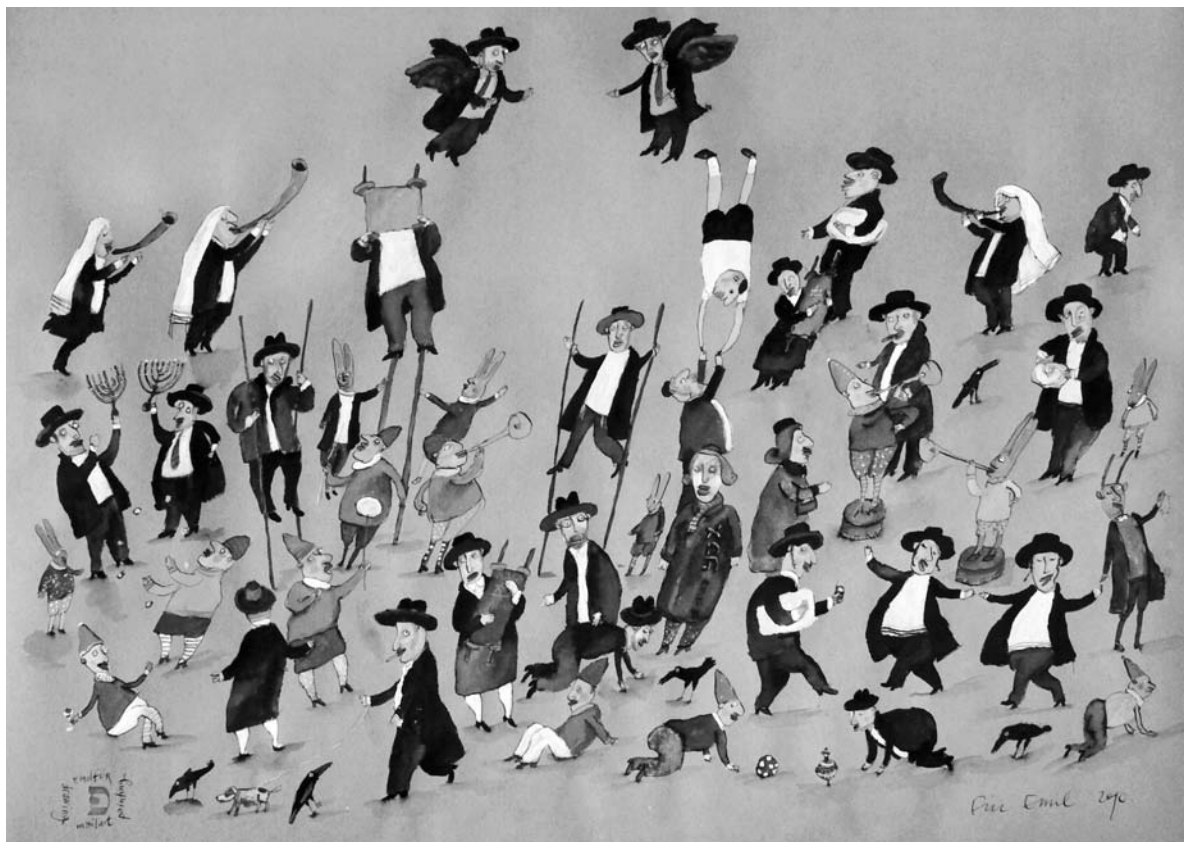
A Gólem Antwerpenben