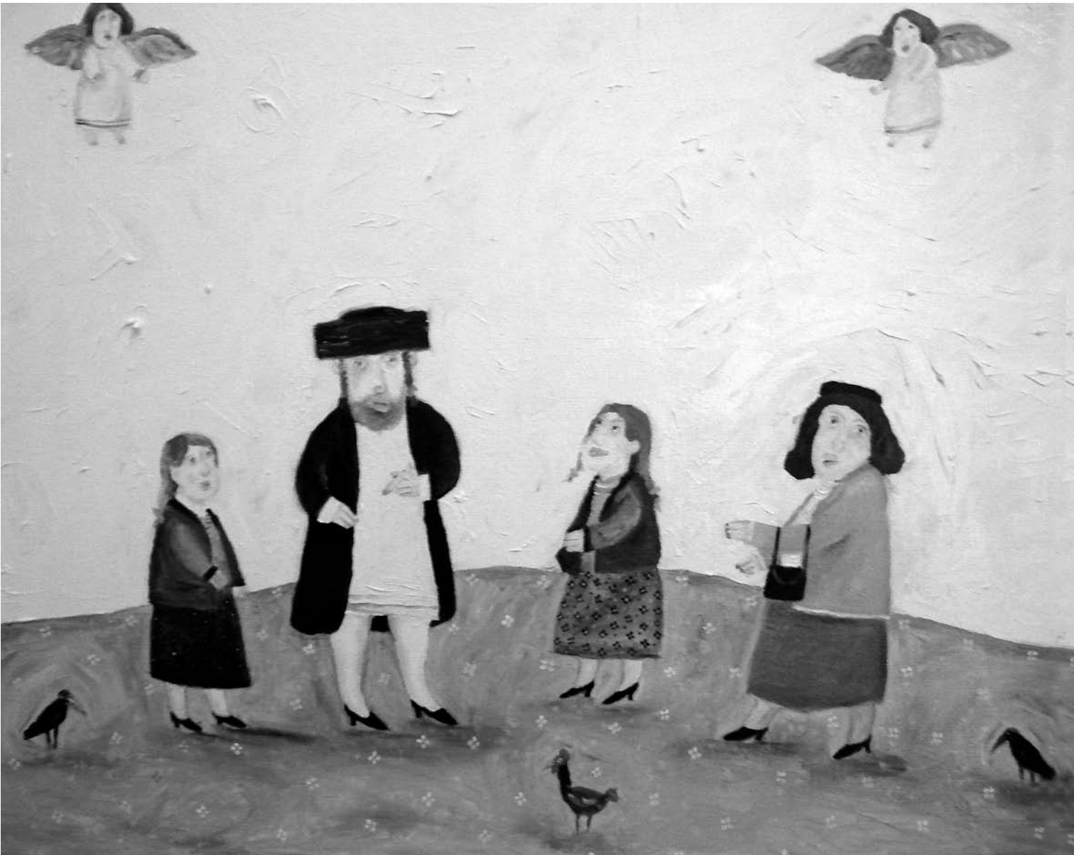
Die ganze Mishpoche