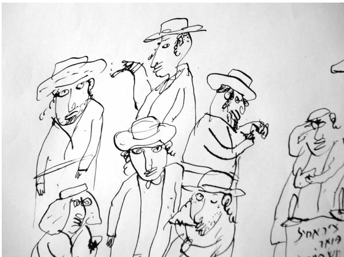
Jerusalem. Mea Sharim (részlet)

Különféle jó, nemes papírokra dolgozom. A rajzok többnyire tusrajzok, illetve guache technikával készült színes rajzok. Gyors, lendületes, tollszármunkák, mint egy japán kalligráfuséi.