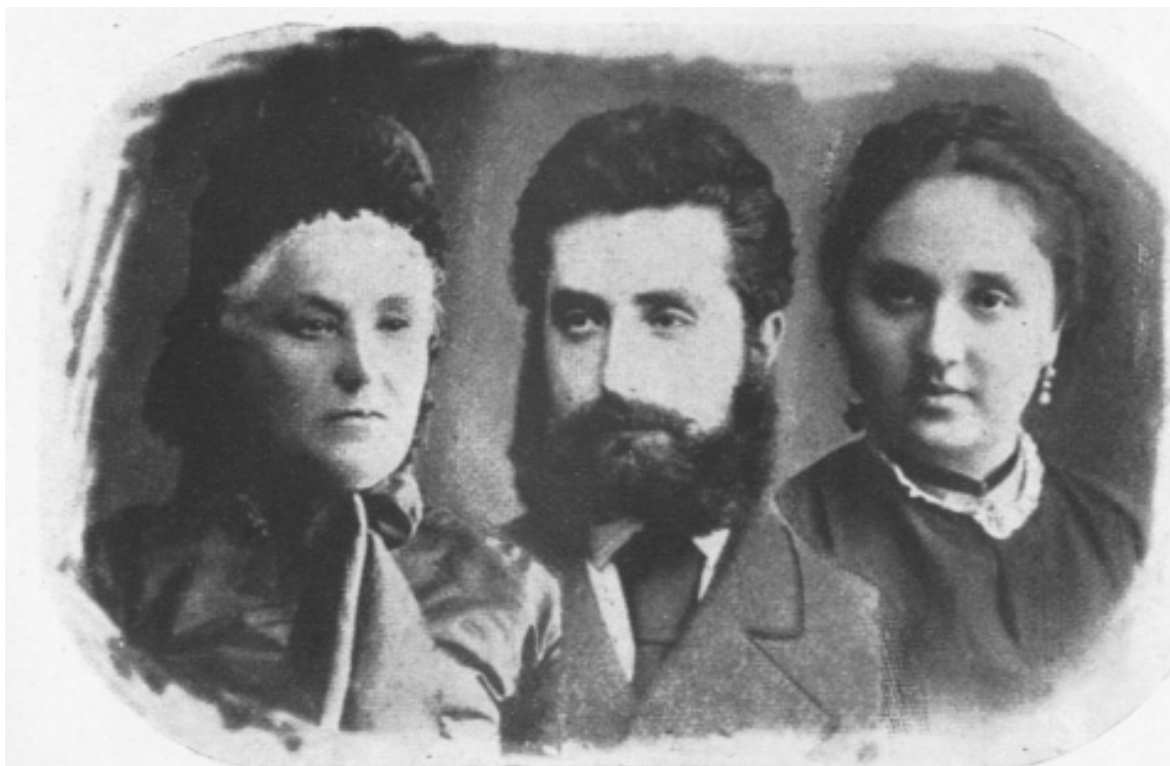
Nordau anyja és nővére

leire, nem sokban különbözött attól, amit Nietzsche szorgalmazott az övéire: „Aki jónak, értéknek és megvédendőnek hiszi a civilizációt, annak ujja hegyével kíméletlenül agyon kell nyomnia a társadalomellenes férgeket” írta Nordau. „Aki Nietzschével együtt lelkesedik a »szabadon kóborló-kéjelgő vadállatért«, annak azt kiáltjuk: »Takarodj a civilizációból!«... Nincs közöttünk helye kéjelgő vadállatnak, és ha közénk merészkedsz, irgalmatlanul agyonverünk botjainkkal.” 39