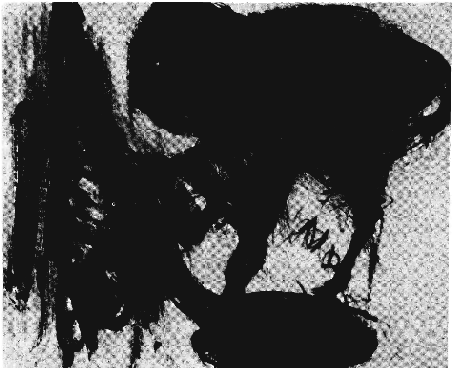
PINCHASZ GOLAN: CÍM NÉLKÜL