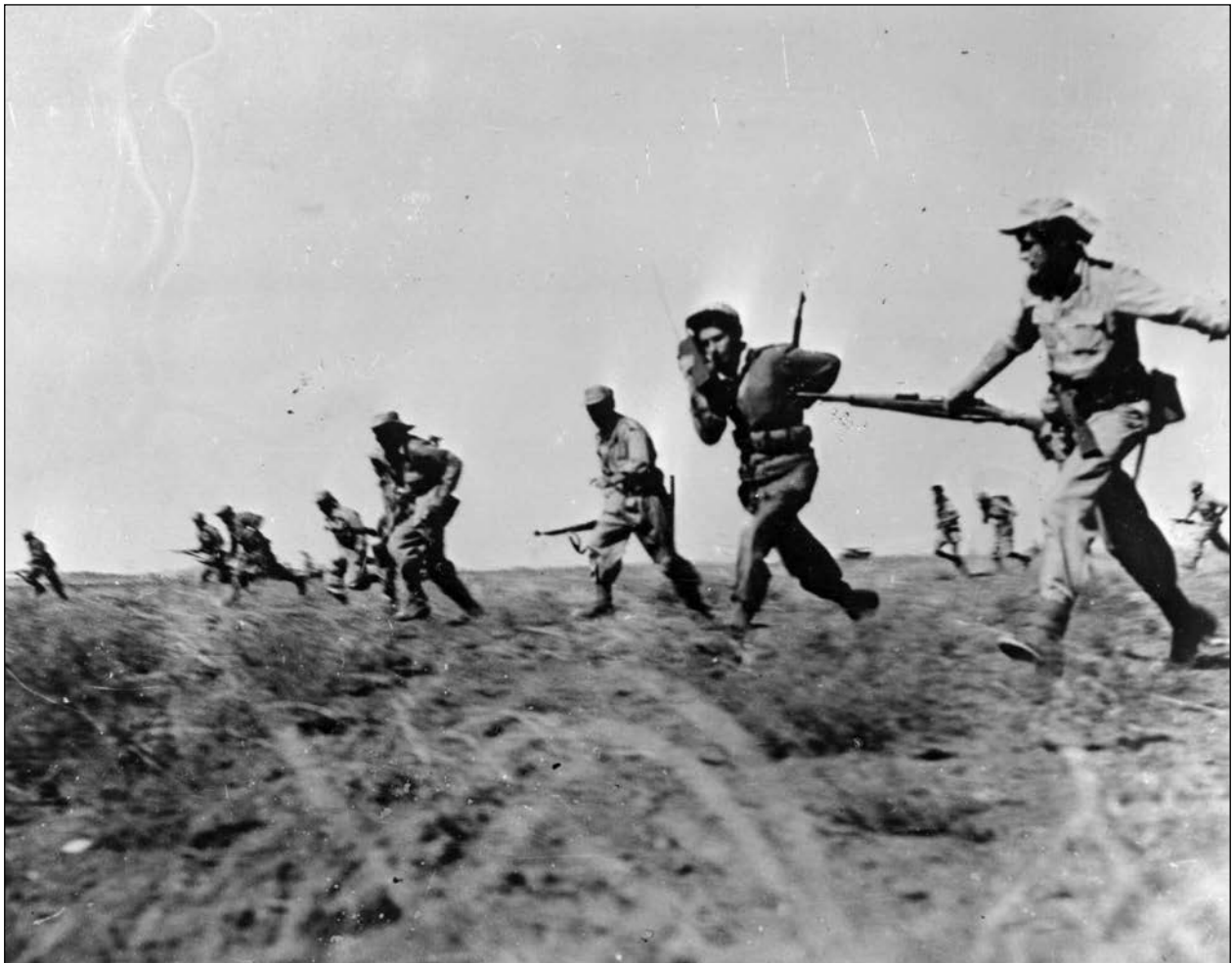
Az izraeli hadsereg Egyiptom fele tör előre a Negev-sivatagban

uralmakat és frontokat. Egyetemesek és individuális képességekhez kötöttek. Jugoszlávia tragédiája abban is rejlik, hogy a szuperhatalmak ellenség híján nem mozgósíthatnak komoly erőket – katonákat, fegyvert, pénzt – az ott folyó gyilkolás megakadályozására, mert az amerikaiak és az oroszok elvesztették egymásban az engesztelhetetlen ellenséget. A mass media minden csepp kiontott vért bemutat. Az oroszoknak azért nehéz Csecsenföldön harcolniuk, mert az elesett kiskatona anyjának is meg kell indokolni, miért küldik harcba a fiát. Jugoszláviában mind a külső, mind a belső akarat igen csekély a háború megakadályozására. Ezért nincs esély a békés kibontakozásra. Mi a saját kiegyezésünket belső érdekelismerésből kezdeményeztük, nem külső fenyegetés hatására. Ahogy könyvemben is írom a végzetes felbomlás tehetetlen erőinek játékszerévé vált Jugoszláviáról; „könnyebb tojásból rántottát készíteni, mint