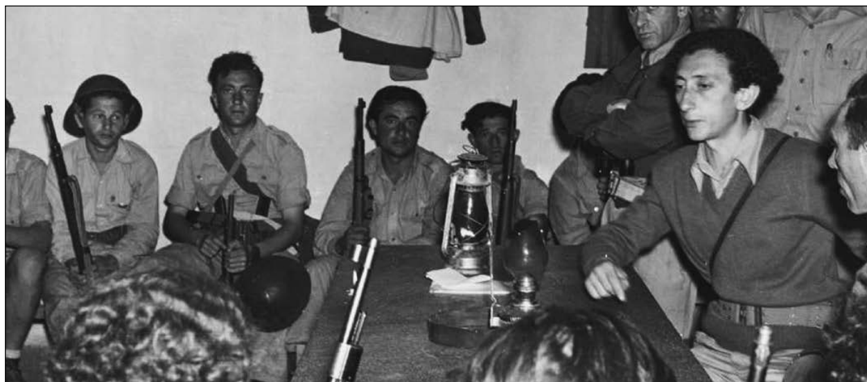
A Hagana-tagok eligazítása 1948-ban

gana („Védelem” cionista paramilitáris szervezet, amely a mandátumi Palesztinában tevékenykedett 1921 és 1948 között) parancsnokai képtelenek összehangolni az erőiket. Hogyan felelnek majd meg a feladataiknak, ha sokkal nagyobb katonai kihívásnak kell eleget tenniük a függetlenség kikiáltása utáni? „Meglépett, hogy a Hagana egyes parancsnokai nem értik meg, hogy nehézfegyverzetre van szükségünk” – vallotta be naplójában. „Háború lesz – jelentette ki a Hagana parancsnokai előtt. – Az arab országok egyesülnek, és... többfrontos harc kezdődik. Már nem szakaszok állnak majd szem-