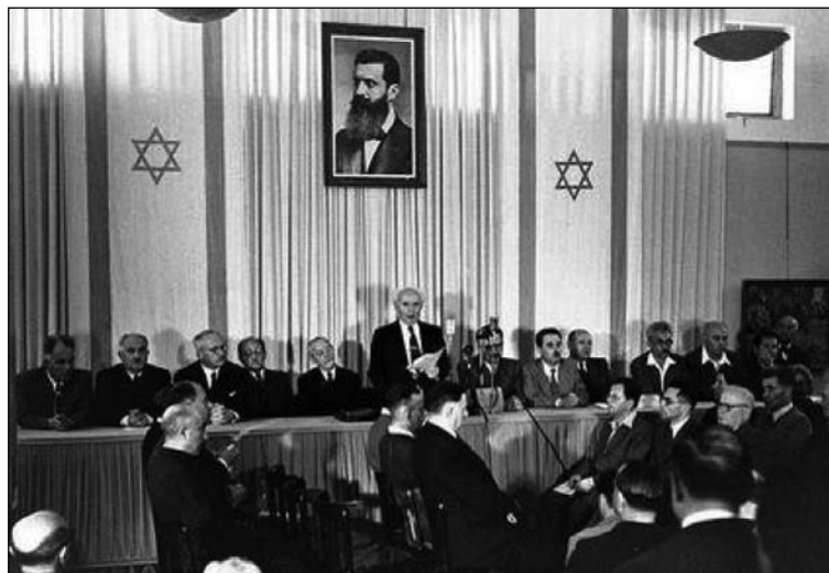
Izrael Állam kikiáltása 1948-ban

vetően felolvasta az Ideiglenes Kormányának a „Függetlenségi Nyilatkozattal összhangban álló” határozatát. A Fehér Könyv előírásai „ezáltal semmiek és érvénytelenek... Az 1940-es földvásárlási szabályok visszamenőleg eltöröltetnek.” („Viharos taps” – jegyezte fel később a naplójában.) Harminchét perccel azután, hogy belépett a terembe, az új állam új miniszterelnöke koppantott a kalapácsával, és bejelentette: „Izrael Állam létrejött. Az ülést berekesztjük.” Naplójában feljegyezte: „Országszerte mélyeséges öröm és ujjongás tapasztalható, én pedig, mint november 29-én, ismét úgy érzem magam, mint gyászoló az örvendezők között.”