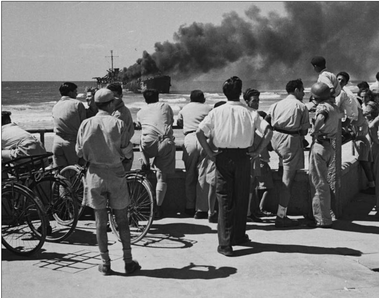
Az Altalena hajó pusztulása

kást, hogy érzelmeink alapján ítélkezzünk emberek felett ahelyett, hogy a tetteiket néznénk. A politika csak a tettekkel foglalkozik. Tény, hogy Jasszer Arafat a század első palesztin vezetője, aki a terror és vak ellenállás periódusai után eljutott a párbeszédig, majd a hatékony tárgyalásokig. Az ember nem választhatja meg a tárgyalópartnerét, mint a barátját. Ő képes leginkább megtestesíteni a palesztin nép akaratát, s nekünk ezt el kell fogadnunk, ha magunk is azt akarjuk, hogy elfogadjanak bennünket. Persze megvannak a saját tervei, érdekei, félelmei és reményei, és ezekkel nekünk számolnunk kell. A legmeggyőzőbb érv az mellette, hogy ő hozta meg a történelmi döntést: a problémáinkat egymással kell megbeszelnünk, nem pedig különböző hatalmak közvetítése révén, ezért vele ültünk le tárgyalni.