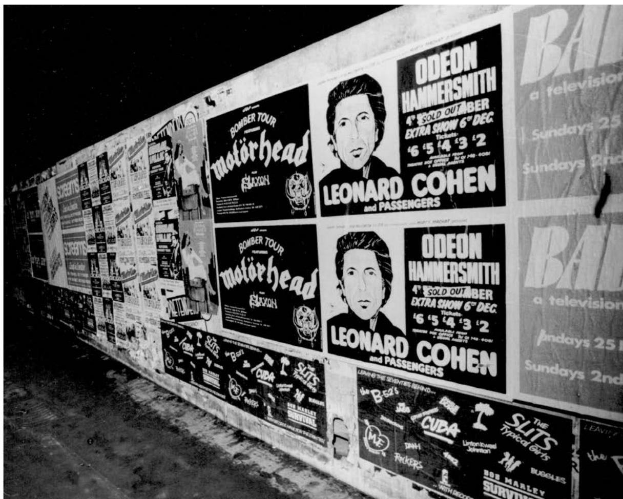
Fotók: Kőbányai János