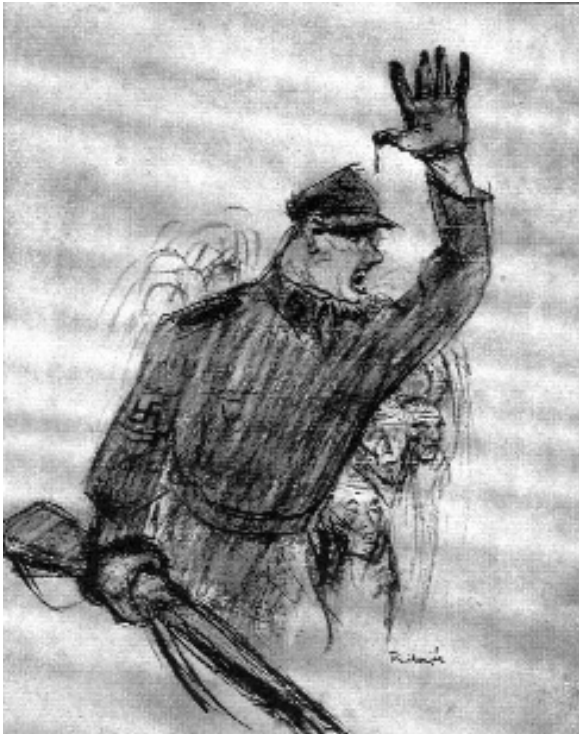
Reichental Ferenc: Arbeit Macht Frei. 1945