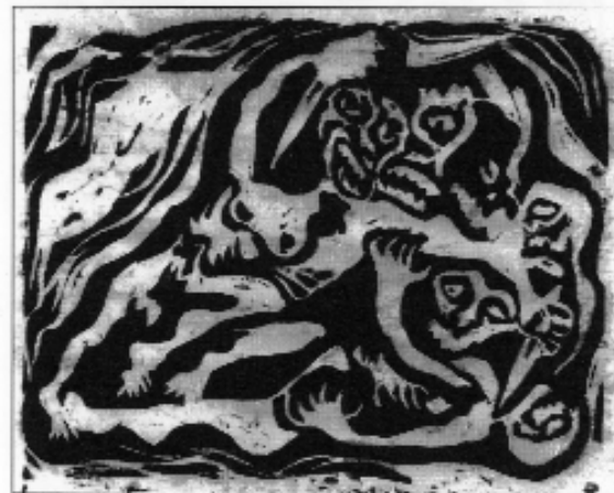
Schnitzler János: Az iszonyat című ciklusból. 1940 k.