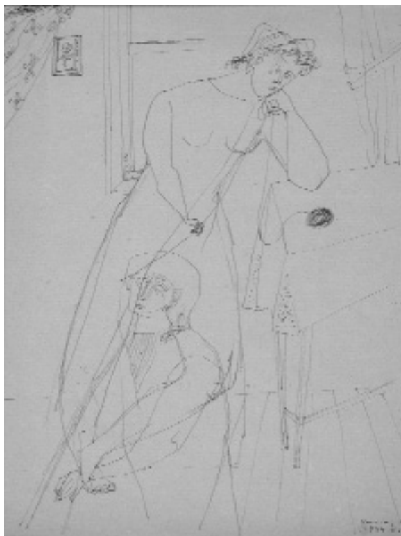
Ámos Imre: Életfonal. 1944

gyar Izraeliták Közművelődési Egyesülete) biztosított kiállítási alkalmakat a zsidó származású képzőművészek számára: 1939 és 1944 között pontosan nyolcszor. Az 1938-ban alakult Magyar Zsidó Irodalmi és Művészeti Bizottság is nagyban segítette a szinte mindenhol kiszorult művészek munkáját. Ezekről az évekről sok mindent megtudhatunk a Magyar Zsidók Lapjából is, amely rendszeresen beszámolt művészeti eseményekről, rendezvényekről. Külön fejezet foglalkozik a kor legjelentősebb kiállító szalonjával, a Tamás Galériával, ahol szinte minden jelentős művész, többek között Ámos Imre, Farkas István, Czóbel Béla, Vajda Lajos kiállíthatott. Naplójában Radnóti Miklós is beszámol a Tamás Galériában tett egyik látogatásáról. Zsidó képzőművészek rendszeresen szerepeltek a KÚT kiállításain is. Hosszabb fejezetet szentel a könyv az 1934-ben megalakult Szocialista Képzőművészek Csoportjának, amelynek tagjai között sok zsidó művészt találunk, köztük az igen tehetséges Bán Béla és (a koncentrációs táborban elpusztult) Goldman György, valamint Bokros Birman Dezső szobrászokat. Az ehhez a csoporthoz tartozó művészek alkotásaikban a többiekénél érzékenyebben reagáltak a politikai eseményekre. Sok szó esik