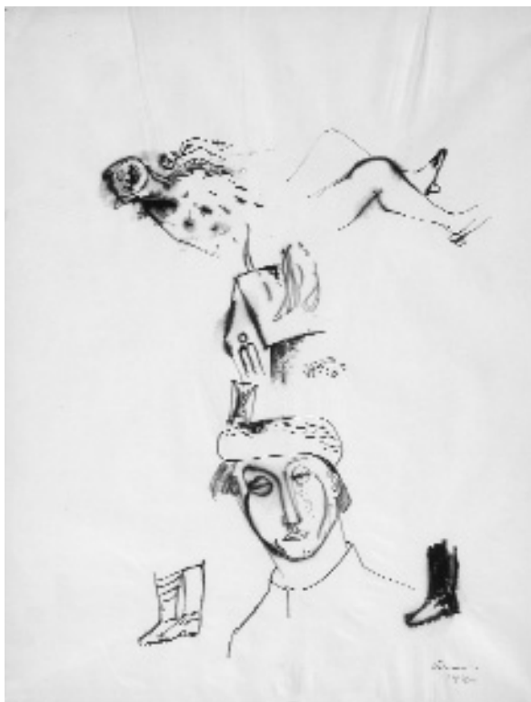
Ámos Imre: Háború, 1940