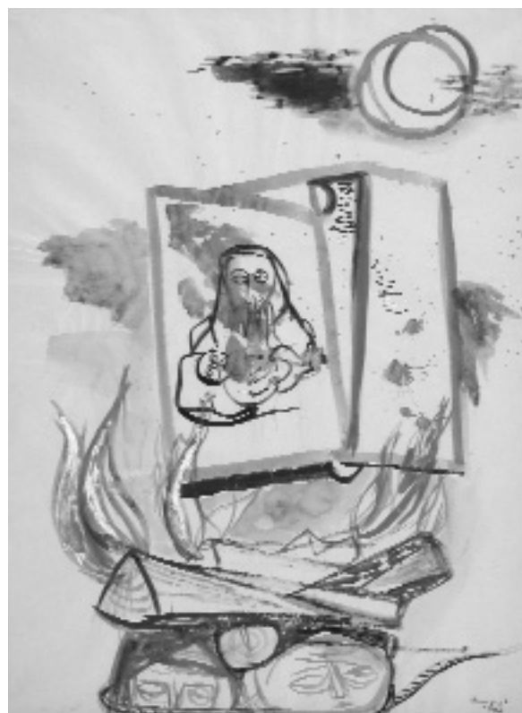
Ámos Imre: Égő fahasábok. 1943