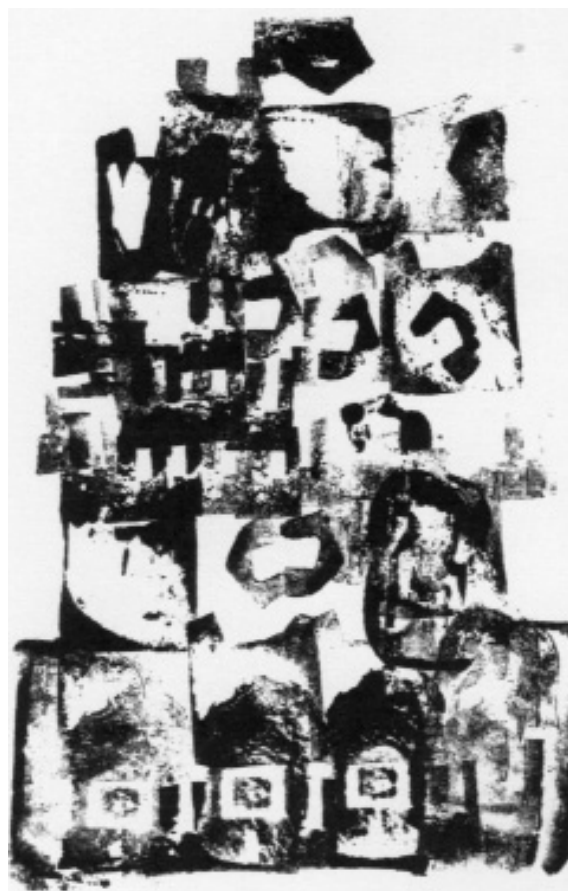
Ország Lili: Sírkövek. 1963