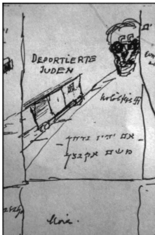
Birnfeld Sámuel: Zsidók deportálása, 1944