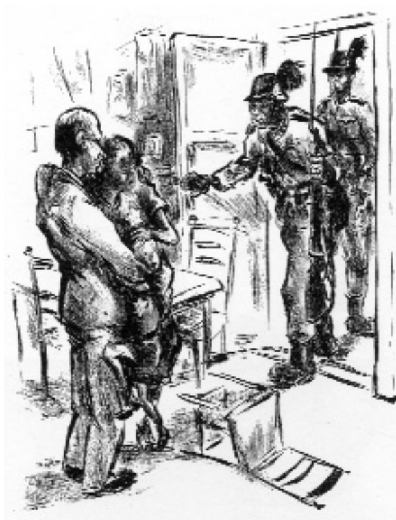
Áldor Péter: Indulás 1946