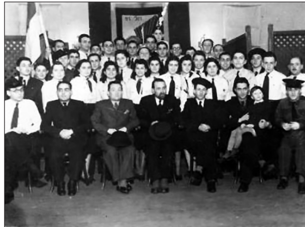
Budapesti Betár, ismeretlen időpont

Az illegális kivándorlás szervezése mellett Szilágyi igyekezett felhívni a magyar zsidósággal történt atrocitásokra a közfigyelmet. Az 1942-es délvidéki „hideg napokat” követően Szilágyi felkereste József Ferenc királyi herceget, akinek átadta Ofner Ferenc volt jugoszláv Betár-vezető információit az eseményekről. József Ferenc, akit Szilágyi „jóindulatú antiszemitaaként” írt le – ugyanis egyik vágyálma volt egy palesztinai „zsidó monarchia” születése – továbbadta az információkat külföldi diplomatáknak. Ugyan más politikusok is tettek az eset nyilvánosságáért – mint Bajcsy-Zsilinszky Endre