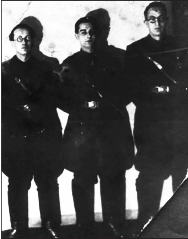
Budapesti Betár, harmincas évek