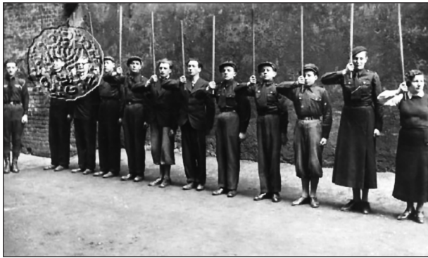
Budapesti Betár, harmincas évek. A sorban vott áll Dov Gruner későbbi cionista mártír

ködsz az előfelvetés cáfolatával?” 18 Sorai radikálisak voltak és úttörőek: egyéb minősítésektől eltekintve elegendő, ha idézzük Nataniel Kacburg izraeli történész sorait, aki úgy fogalmazott, hogy Szilágyi „józan analízise” „új elemeket szűrt be a zsidó-magyar vitába”. 19 Zeke Gyula a Szombat hasábjain megjelent esszéjében valamivel kritikusabb volt Szilágyival. 20