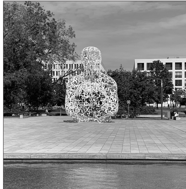
A Johann Wolfgang Goethe Egyetem, Frankfurt am Main. Az 1995-ben alapított, a holokauszt történetét és hatását kutató Fritz Bauer Intézet az egyetem keretében működik

Az persze köztudomású volt, hogy az Auschwitz-per háttérében Bauer áll, hiszen rendszeresen beszámolt a sajtónak a nácikkal szemben folytatott el-