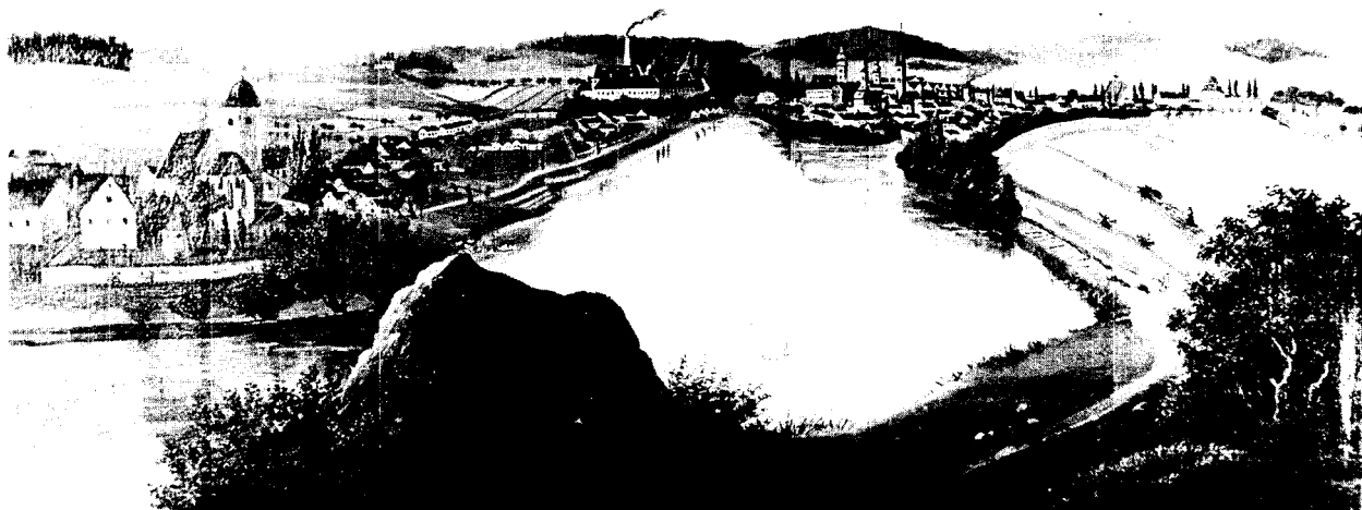
Telő múlt századi látképe

Die Augenkrankheiten a neves nagyváradi nyomdász és könyvkiadó Tichy család műhelyében készült, a korabeli nyomdatechnika legigényesebb, ízléses kivitelezésében.