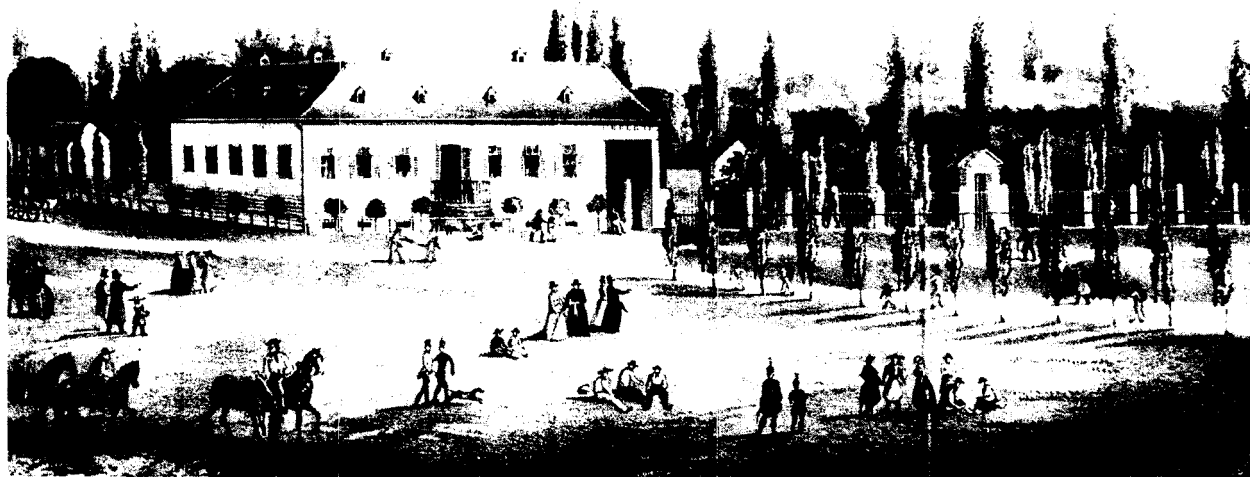
A nagyváradi szemkórház látképe. Könyomat, 1847.