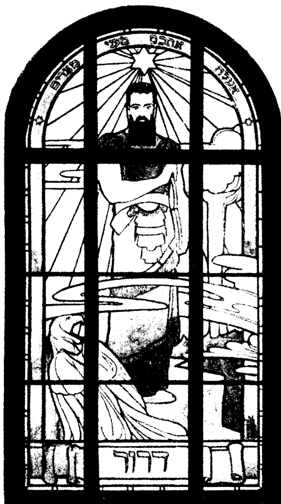
Herzl mint Mózes a hamburgi Bnei Brithpárholy ablaküvegén

– a probléma megoldását illetően mindketten holisztikusan az egész nép helyzetén való gyökeres változásban, változtatásban gondolkodtak;