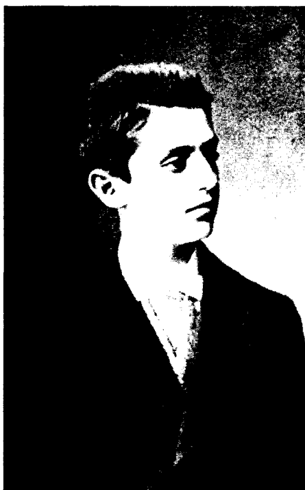
Herzl Tivadar mint a pesti evangélikus gimnázium növendéke

Mit is ért Ellenberger kreatív betegségen? „Ez egy olyan sajátos, akcentuált pszichés-pszichopatológiai állapot, amelynek során az egyén váratlanul valamilyen kóros lelki állapotba kerül. Fenomenológiailag ez lefolyhat depresszióként, felléphetnek neurotikus panaszok, vagy akár pszichoszomatikus rosszulletek is. Pszichotikus állapot (tehát paranoid, akár schizoforn tünetegyüttes) alakulhat ki. Ezek az egyén életében eddig ismeretlenek voltak, lezajlásuk után nem szoktak ismét jelentkezni. Az