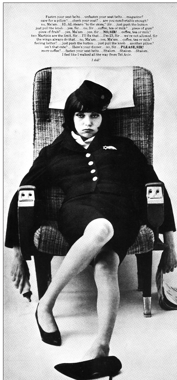
Önironikus EL AL képeslap 1962-ből egy légiutas-kísérőről, aki leszállás után úgy érzi, végig gyalog jött Tel-Avivból

A hatnapos háborút lezáró békekötéssel nem szüntek meg teljesen az ellenségeskedések. A következő években számos terrortámadást követtek el az izraeli légitársaság járatai, utasai és személyzete ellen. 1968-ban arab terroristák Algériába térítették a római járatot, de végül mindenki épségben szabadult. Az ezt követően Athénben, Zürich-