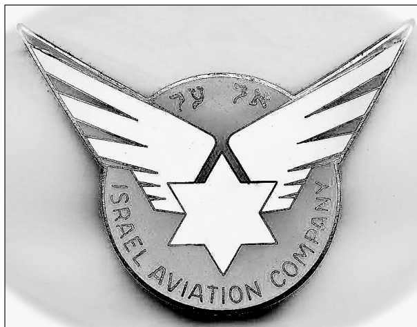
EL AL kapitányi sapkajelvény, 1949–1950 (Marvin G. Goldman gyűjteménye)

Már a harcok során bebizonyosodott, hogy egy ellenséges és barátságtalan szomszédoktól körülvevett ország számára létszükséglet a hatékony önálló légiszállítás. A külföldi légitársaságok az ellenségeskedések miatt veszélyesnek ítélték és felfüggesztették izraeli járataikat, így a fiatal állam csak saját kapacitásaira támaszkodhatott. A nemzeti légitársaság megalapítását egy váratlan esemény is siettette. Chaim Weizmant, az állam első elnökét haza kellett hozni Genfből, de a semlegességére kínosan ügylező Svájc katonai gépet nem engedett a terüle-