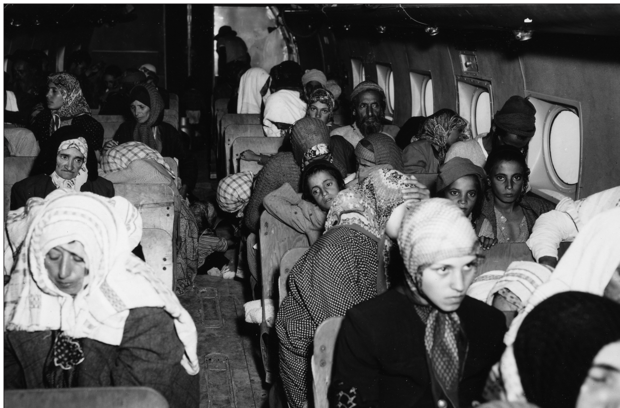
Az El Al DC-4-es gépének zsúfolt utastere 1949-ben 1200 jemeni zsidó Izraelbe menekítésekor

kellett szembenéznie. Az európai és amerikai konkurensek modernebb, túlnyomásos kabinnal ellátott gépei gyorsabb és kényelmesebb repüléssel csábították az utasokat.