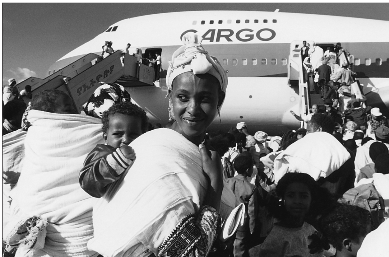
Etióp zsidók beszállása Izrael felé a Salamon-akció keretében, Addisz Abeba, 1991

47 000 jemeni, 1500 ádeni, 500 eritreai és 2000 szaúdi zsidót sikerült légi úton Izraelbe juttatni. A szállítás hatékonyságát azzal is javították, hogy a többségükben csontsovány menekülők közül akár 100-120-at is beszállítottak az eredetileg 50 fő befogadására tervezett DC-4-esbe. A sokat átélt menekülők belenyugvással fogadták a zsúfoltságot a soha nem látott gépmadarak gyomrában. A csodálkozás sora inkább a pilótákon volt, amikor hálás utasaik menet közben forró teával kedveskedtek nekik, noha a fedélzeten nem is volt vízmelegítő készülék. Kiderült, hogy a találékony pusztai nép fia nem egyszerűséggel tüzet raktak a széksorok között a víz felforralásához.