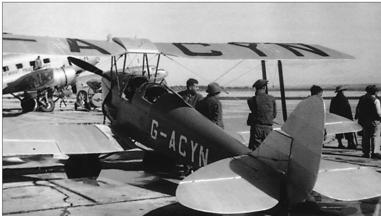
Lydda repülőterén az izraeliek első motoros gépe, az 1934 szeptemberében beszerzett De Havilland D.H.82A Tiger Moth, 1938 körül

leszállásra és üzemanyag-feltöltésre volt szükségük. Ilyen célt szolgált többek között a Tiberiasnál működő repülőtér, amelynek közelében, a Galilea-tenger vizén az akkoriban széles körben használt hidroplánok is landolhattak.