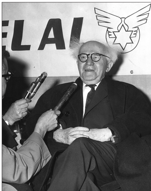
David Ben-Gurion, Izrael állam és az izraeli repülés megalapítója hazaérkezéskor nyilatkozik

varos Bristol Britanniákra, amikor az élvonalbeli légitársaságok többsége még dugattyús motorral hajtott gépekkel járt. Az angol gép adatai magukért beszéltek. A forradalmian új gázturbinás hajtásnak köszönhetően minden fontos területen ugrásszerűen javultak a paraméterek. A gép százfős befogadóképessége duplája volt elődjének. Utasait szédületes 640 km/h sebességgel akár 6900 km távolságra repíthette, sőt egy esetben – alighanem némi hátszéllel és nem teljes terheléssel – leszállás nélkül tette meg 15 óra alatt a 9800 kilométeres távot New Yorkból Tel Avivba, amivel új polgári világcsúcsot állított fel. Az új gépen az utasok komfortja is sokat javult, nemcsak a kényelmes ülések és a minden jóval felszerelt konyha révén, de elmaradt a dugattyús motorok fülsüketítő dübörgése is, amit a gázturbinák jóval szolidabb süvítése váltott fel. Minden fejlődés dacára a légszavak még mindig olyan zajosak voltak, hogy a fedélzeten az első osztály 18 ülését a gép – valamivel csendesebb – hátuljába helyezték.