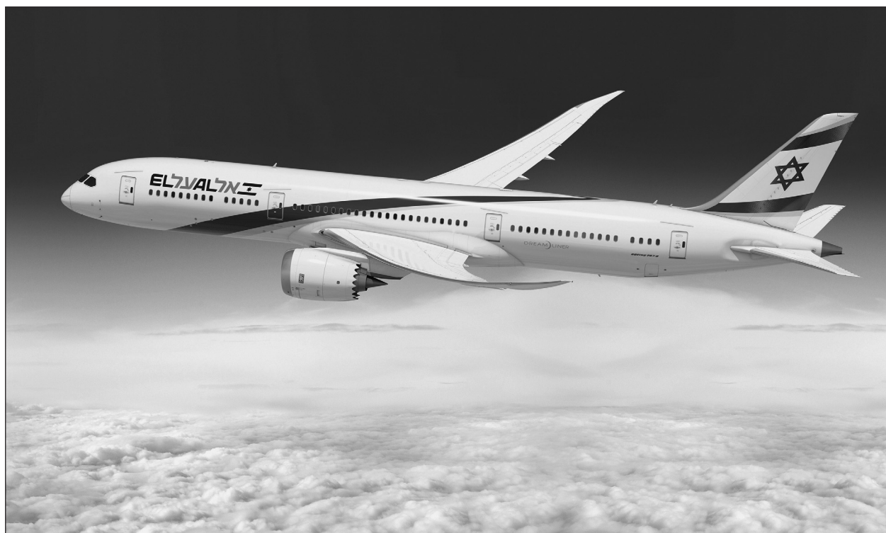
Számítógépes grafika az El Al legmodernebb, Boeing 787-es Dreamliner gépéről