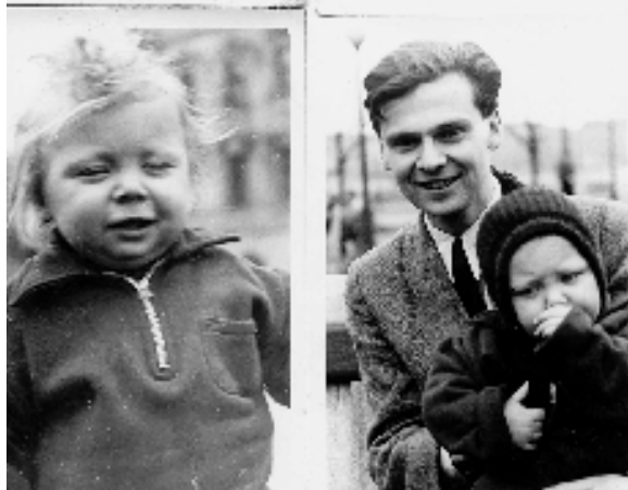
Az apai (kín)rímfaragást öcskösöm se úszta meg