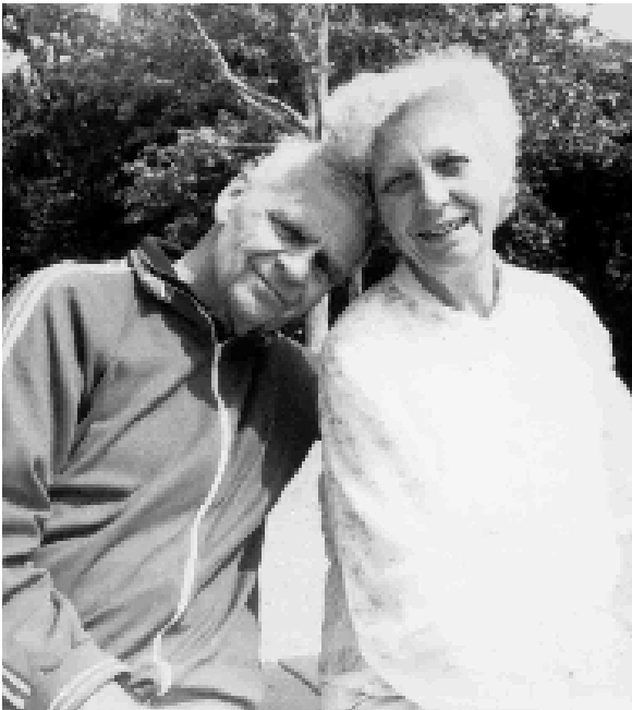
A két jó öreg... Immár Mamóca és Papóca (2000-ben)