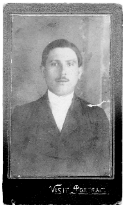
Szekefű-nagyapapa, valószínűleg vőlegényként. Már „embernek” számított, hiszen – nem sokkal előbb – megverekedte Doberdót, Isonzót. (1920-as évek legeleje)