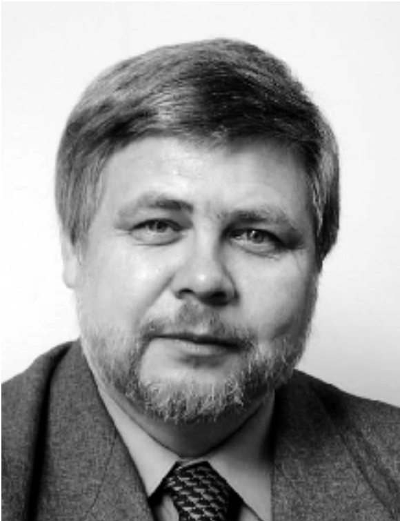
A középkorú, egyetemi oktató testvérem (a régi kedvesség, melegség, segítőkészség most is ott van a szemében, ez az attitűd nem csupán a fotózásoknak szól). Nagycsaládunkban ő a szikla