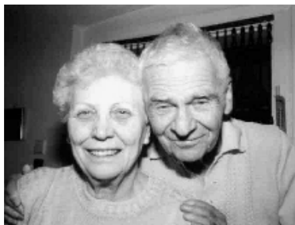
Ajaj! Mi a fityfirittynek idősödtek?! A vénüléssel még ráérték! (Szüleim, 2002-ben)

Ebben a pillanatban, az írás végéhez közeledve ismertem fel, hogy dolgozatom egyértelműen „zsidósra” fogalmazódott. Ezt vállalom, fenntartom. Felelet a jelen hazai és nemzetközi környezet antiszemitizmusára (meg erre hajló közönyére). Félzsidó vagyok és egészmagyar , ám amióta élek, állandóan a zsidóságomban éreztem magamat veszélyben. Úgy gondolom, hogy a náci koncentrációs táborokban teljesen vétlen magyarokat pusztítottak el (akik még fegyvert sem fogtak, pontosabban foghattak, hiszen miként birkózik meg a puska súlyával egy csecsemő, akkor is, ha zsidó...). Úgy gondolom, hogy a holokauszt Mohácsnál is nagyobb Mohács, Trianonnál is tragikusabb Trianon. Úgy gondolom, hogy anyám fivére, aki 1944 késő tavaszán elesett a Kárpátok előterében (odaküldte a messze város, megállítani mannlicherével a már folyamatosan ellentámadó Bolsevista Rémet) nem hősi halott, de áldozat, mégpedig ugyanazon rendszer és bitangjainak áldozata, amely és akik asszonyokat, öregeket, gyerekeket irtottak ki családom zsidó ágából (s őket, eltérően szerencsétlen ifj. Szekfű Józseftől és társaitól, meggyilkolásuk előtt még éveken át megbélyegezték, erkölcsileg megalázták, javaikból kiforgatták...). Úgy gondolom, hogy itt, a Duna két