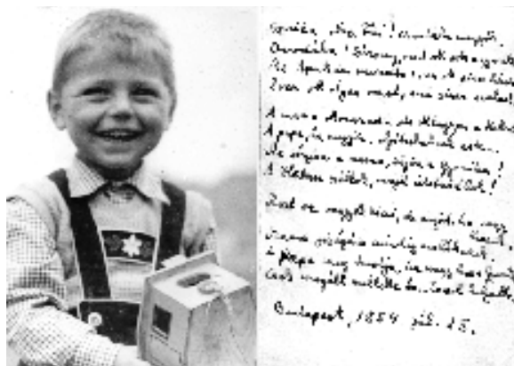
Apám hallatlanul élvezte az újdonsült szülőszerepét. Ezért hát „megverselt” engem

– Te is tudod, Gyuri, az én Apukám öreg és beteg, sok gyötrelmet megélt. A koncentrációs táborban – tizenhat évesen – valóban elvesztette az Anyukáját. Korán el- vesztette, megölték gonosz emberek, s így nem lehetett módja Anyukáját (azt a nagymamánkat, akit – emiatt – mi csupán elbeszélésekből ismerünk) egyedül kellően