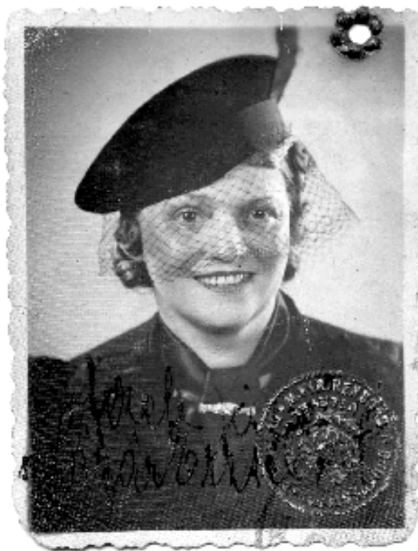
A legkedvesebb (mert a legvarázslatosabb) képem Elza-mamáról (1938. április).

Soha nem bocsátom meg a faszizmusnak, a magyar revizionizmusnak (Trianon-ágálók), hogy lemészárolta/lemészároltatta ezt az asszonyt. Minden fasisztában, antiszemitában óhatatlanul nagyamamám gyilkosainak megtestesülését látom, a holokausztal szemben közönyöseket pedig az akkori cinkosok-haszonlesők mai megjelenéseinek tekintem!