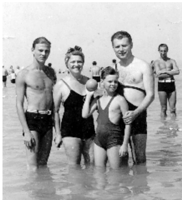
Feketéék talán utolsó „gondtalan” nyaralása (Siófok, 1938 augusztusa)