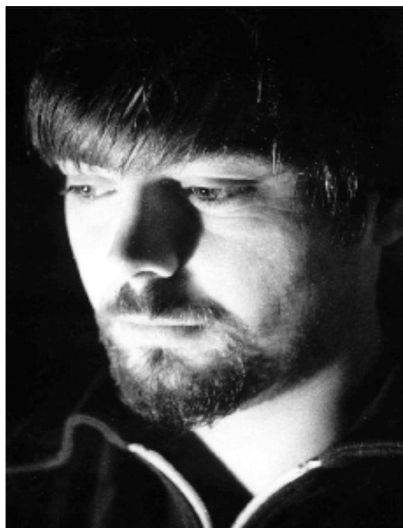
Ez én lennék, egyetemi létem vége felé. A testvérem kívárta „sztár-beállítás” – akkoriban operatőrnek készültem, s lopva kapott le – ügyesen leplezi az akkoriban már igencsak dúló lelki háborgásaimat (1974/75. két pszichiátriai „vendégeskedésem” közti félidőben)