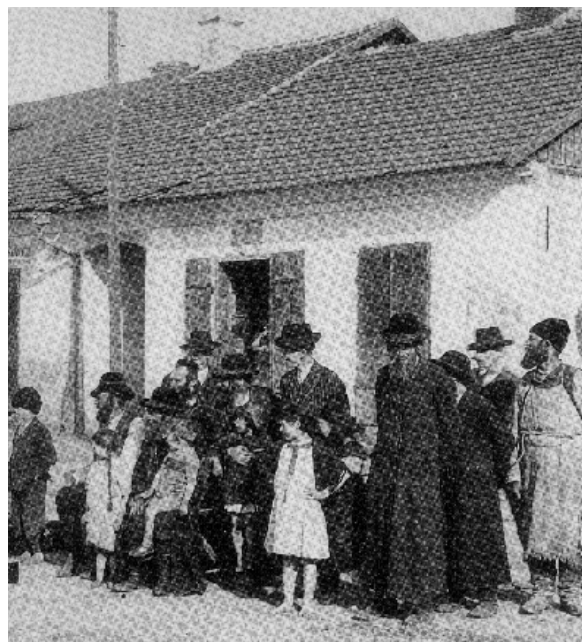
Zsidó család egy galíciai stettben

Első galíciai utazása valósággal sokkolta II. Józsefet, megdöbbenette a zsidóság szociális