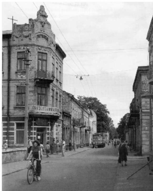
Brody főutcája napjainkban

A széles körű jogok és kedvezmények mégsem oldották meg a galíciai zsidóság legnagyobb gondjait, továbbra is nagy volt a kivándorlás és nagy volt a belső migráció is. Az életkörülmények egyáltalán nem javultak, sőt inkább tovább nőtt a zsidó bűnözés és bűnözők száma. A magas népszaporulat miatt a lakáskörülmények egyre elviselhetetlenebbek lettek, erről II. József személyesen is meggyőződhetett, amikor 1786 áprilisában Lembergben járt, de ugyancsak hasonlókat tapasztalt 1787-ben az „Új Jeruzsálem”-ben, azaz Brodyban, ahol abban az időben 18 000 zsidó élt. 105 A császár kísérlete arra, hogy a galíciai zsidóságot a mezőgazdaságban foglalkoztassák, minden törekvés és a kedvezmények ellenére kudarcot vallott. Ezért 1785 után is számos intézkedéssel próbálta a helyzetet korrigálni, de már ekkor látszott, hogy újabb, az eddiginél is átfogóbb rendeletre lesz szükség.