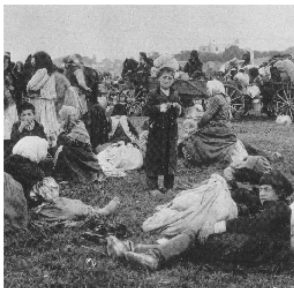
A cári csapatok elől menekülő galíciai zsidók 1915-ben

Az első katonai felmérés szerint 1773-ban 224 981 zsidó élt Galíciában, összehasonlításképpen ugyanebben az időszakban (1780) Magyarországon 46 166. 60 Az első évek felmérései, főleg az 1773–1776 közötti időszak felmérései megbízhatatlanok. Ezt részben a módszertani hibák, részben a már említett felméréseket végző Galíciába küldött hivatalnokok képzetlensége és tájékozatlansága okozták. A módszertani hiba forrása az volt, hogy míg az első évben (1773) valóban a lakosság körében végezték a népszámlálást, addig a következő évben már az előfelmérés alapján összeállított ún. Populationsbücher (népességnylvántartó) alapján kalkulálták ki a népességszámot. Ez a technika súlyos torzításokhoz vezetett, amelyet utólag szinte lehetetlen korrigálni. Ráadásul az első felmérésből kihagytak legalább 800 települést, mivel a határok még nem voltak pontosan rögzítve. Az adatok valóságtartalma azon mú-