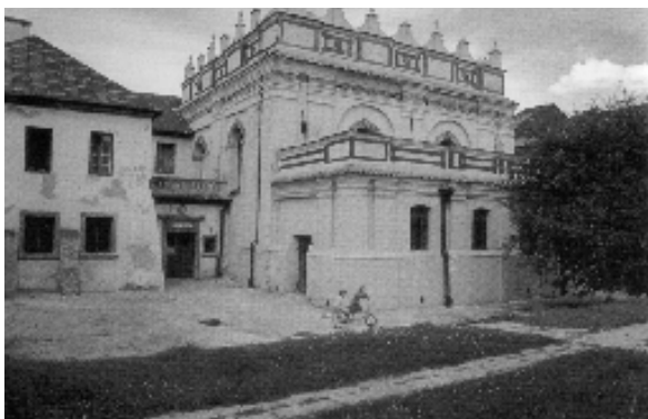
Egykori zsinagóga Zamoscban. Ma könyvtár

tosuljon a hatalom. 47 Fontos megjegyeznünk, hogy a zsidó közösségeken belül sokkal nagyobb volt a mobilitás, mint az őket körülvevő keresztény társadalomban. Nem voltak merev kasztok, elméletileg sohasem lehetett kizárni, hogy bárki közülük meggazdagodik, mint ahogy a tehetősek sem gondolták feltétlenül öröknek a vagyonukat és a hatalmukat.