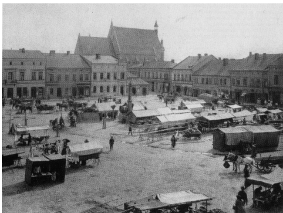
Amikor még csak egy galíciai kisváros volt – Auschwitz főtere 1906-ban

tartomány fejlődésének minden hátránya és a mindegyik nemzetiségre egyaránt jellemző megmagyarázhatatlan fásultság uralta.