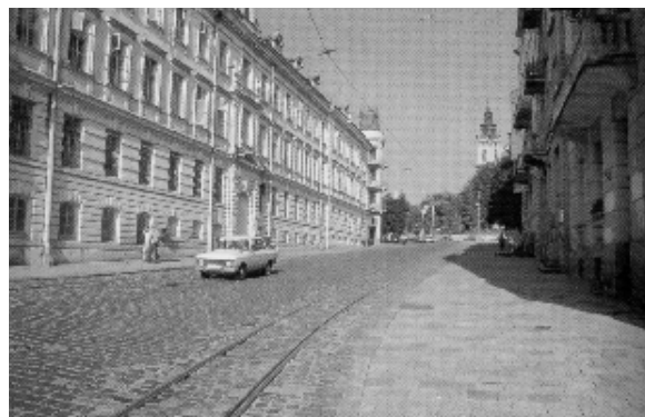
K und K – Lemberg főutcája

Ez a gyülekezeti struktúra nemcsak Lengyelországra volt jellemző Európában, de talán itt teljesedett ki leginkább a hatásköre. Egyedülálló volt a lengyel zsidóságnál a régiók, azaz országrészek közti együttműködés. Több országban tettek kísérletet arra, hogy létrehozzanak egy minden zsidó közösség felett álló szervet, de ez igazán csak Lengyelországban valósult meg. Ezeknek az országrészeknek (Nagy-Lengyelország, Kis-Lengyelország, Vörös-oroszország és Litvánia) a küldöttei – akik a rabbik és a kahal elöljárói közül kerültek ki – évente a waad nak nevezett tartománygyűléseken – amelyet a „Négy ország tanácsának” is neveztek – döntöttek a zsidóság életét érintő legfontosabb kérdésekről. Elsősorban az adók beszedéséről és annak újra befektetéséről folyt a vita, de szükség esetén az uralkodóhoz is fordultak. 54 1581-ben Lublinban ült össze először a zsidó országgyűlés, amely megválasztotta sorraiból a vezetőséget ( generalitas ), melynek élén az ún. marsall állt. 55 A waadok hatévenként választották meg a zsidó marsallt, aki a lengyel zsidóság feje lett, ezáltal ő képviselte a zsidóságot a királyi udvarnál, ő rendelkezett a kivetett adók mértékéről. Előfordult, hogy egy-egy te-