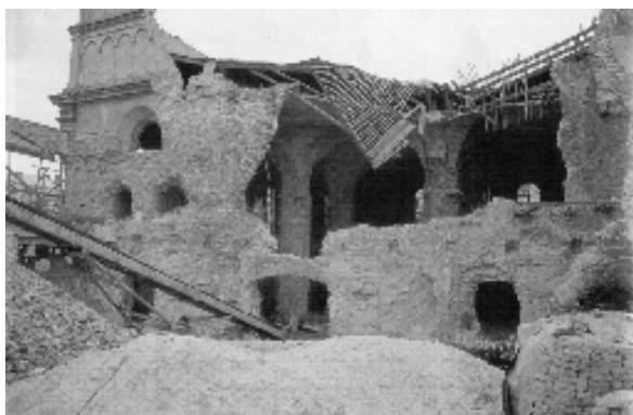
Brodi zsinagógája ma

– 1905-ben lakosságának 72 százaléka volt zsidó