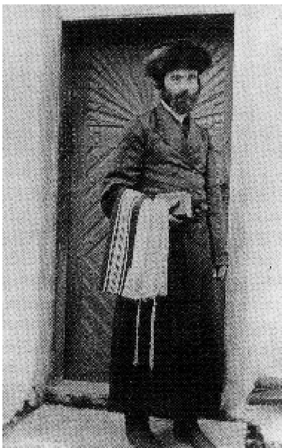
Krakkói zsidó a zsinagógába menet

burg Birodalomban nem élt ekkora területen ilyen nagy létszámú zsidó lakosság, 36 ennyire sajátos státussal és kiváltságokkal felruházva. Ennek gyökereit a középkori Lengyelország történelmében kell keresnünk.