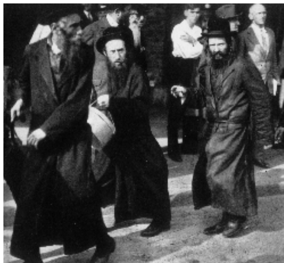
A modern antiszemitizmus céltáblái – galíciai bevándorlókat támadnak meg Berlinben

II. Lipót uralkodása alatt arra is történtek kísérletek, hogy a zsidóságot kivonják a kötelező katonai szolgálat alól. Ezt nemcsak Galíciában érezték a zsidók óriási tehernek, hanem a Monarchia más tartományaiban is. Már 1790. november 27-én a csehországi zsidók egy csoportja memorandummal fordult a császárhoz, hogy mentse fel őket a katonáskodás alól. 130 Galíciában, ahol nagyon korán (13-14 éves korban)