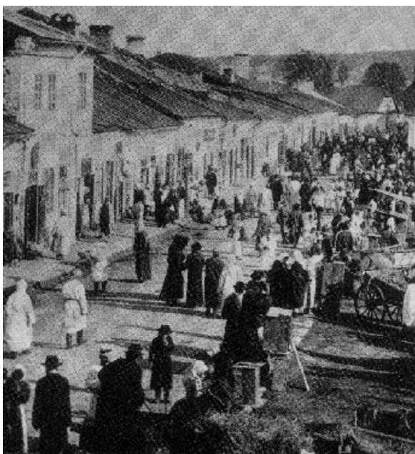
Vásár Rawa Ruskában

tartomány lett, de Bukovina Hercegség néven a Monarchia része maradt. Az utolsó területi változás 1866-ban történt, amikor Auschwitz-Zatori Hercegség ismét Galícia része lett. Ekkor a tartomány területe 80 200 négyzetkilométer volt, amely a Habsburg Birodalom bukásáig már nem változott. 12