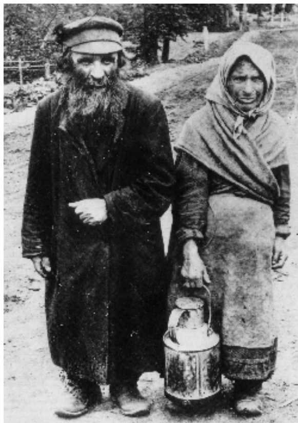
Bukovinai zsidó pár

Mint már említettem, II. József összeegyeztette fiziokrata elképzeléseit a zsidóságpolitikával, a mezőgazdaságba szerette volna őket integrálni. A rendeletekből is láttuk, a bécsi kormányzat számos könnyítéssel és kedvezménnyel próbálta a zsidókat a mezőgazdasághoz kötni, a földbirtokosokat pedig arra kötelezték, hogy birtokaikon hozzanak létre a zsidóság számára telepeket és szorgalmazzák, hogy minél többen éljenek a falvakban. Bár a zsidó-