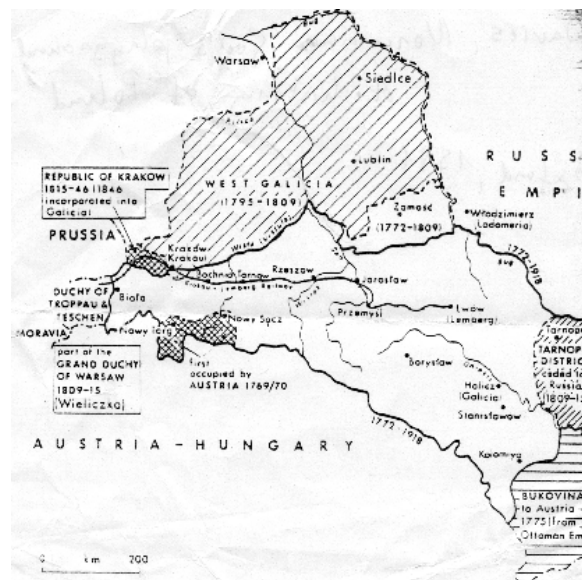
Galícia 1773–1918 között

1796–1797-es szerzeményeiről, Zamosc körzetről és a Visztula jobb partján lévő, Krakkótól délre eső Podgorce térségéről. Wieliczktát a sóbányákkal együtt a Varsói Nagyhercegség és Ausztria közös birtokának tekintették. Tarnopol körzetét teljesen, Zaleszczyki, Zloczów, Brzezany körzetek egy részét pedig – közel 400 ezer lakosával együtt – az oroszoknak kellett átadnia. 9