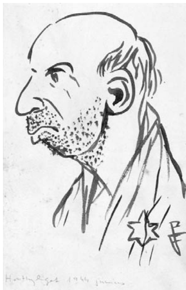
Porscht Frigyes: Sárga csillagos arckép

Farkas István a 20. század egyik legnagyobb festője, Auschwitzban gázkamrában pusztult el 1944. június 29-én vagy 30-án. Goldmann György igen jelentős szobrász 1945. február 10-én Dachauban. A nagybányai festő, Klein Sándor 1945. januárban vagy Auschwitzban, vagy