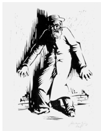
Schönberger (Hegyi) György: Akiket a falhoz állítottak

1940 augusztusa, a területek visszacsatolása után a hivatalos magyar művészetpolitika azonnal megpróbálta az erdélyi művészek munkásságát a „nagy magyar” művészeti élet részévé tenni, budapesti kiállítási lehetőségeket biztosítani a Nemzeti Szalonban, a Műcsarnokban és másutt.