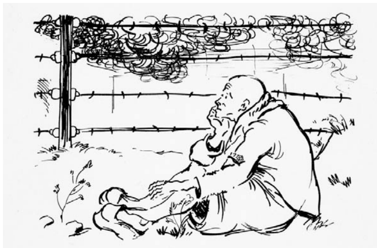
Lukács Ágnes: Auschwitzi női tábor

A német megszállást, majd a sárga csillag viselését előíró rendeletet követően a katolikus egyház hercegprímása, Serédi Jusztinián tiltakozott a megkeresztelkedett zsidók – köztük papok, apácák – Dávid-csillaggal történő megjelölése, később a gettókba kényszerítése ellen is. A református és evangélikus egyház vezetői is a megkeresztelkedettek érdekében tárgyaltak, mentesítést főként tudósok, művészek és katonák számára próbáltak szerezni. 5 (Mathias Goeritz 1945–46-ban készített Keresztrefeszítése n és 1947–50 közötti Auschwitzi Megváltó sorozatán azzal vádolja a keresztény egyházat, hogy meg sem próbálta megmenteni a zsidókat a holokauszt idején.)