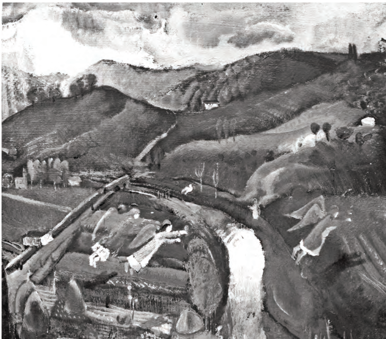
Vadász Endre: Angyalok, olaj, 36x34 cm. Magyar Zsidó Múzeum és Levéltár, Ltsz.: 64.2065

nyai befejeztével Lyka Károly bátorítására iratkozott be a budapesti Királyi Magyar Pázmány Péter Tudományegyetem művészettörténet szakára, s így útkeresése ezen szakaszában a gyakorlati alkotói kifejezőmód megoldásai felől egy szisztematikus, értelmező, összegző elméleti kutatás irányába mozdult el. Festészeti munkáján az önálló kritikai szemlélet helyett inkább más, nagy hatású művészek alkotásainak reflexióját érzem, miközben az elméleti munka egyáltalán nem jelölt számára háttérbe vonulást, inkább egy alapos, alapvető hiánypótlást, olyan ismeretek nagyközönség elé tárását, aminek folytatása szinte a mai napig hiányzik.