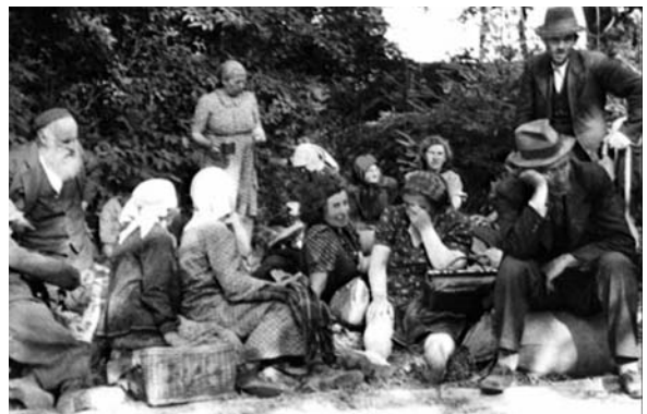
Hontalan zsidók összegyűjtése és deportálása. 1941 nyara

Az észak-erdélyi zsidó közösség ugyancsak megszenvedte az 1941 nyarán a magyarországi hatóságok által életbe léptetett „idegenellenes” kampányt. Ez az intézkedés Észak-Erdély valamennyi vármegyéjét érintette, ám különösen a Máramaros és a Szatmár vármegyei közösségeket sújtotta, ahol meghatározhatatlan számú zsidót gyűjtöttek össze mint „idegent”. Ők a mintegy 16 000 – 18 000, Magyarország területéről Kamenyec-Podolszkij közelébe deportált zsidó közé tartoznak, akiknek többségét 1941. augusztus 27 – 28-án lemészárolták.