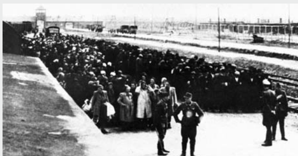
Egy beregszászi traszport megérkezése Auschwitz-Birkenauban 1944 május második felében