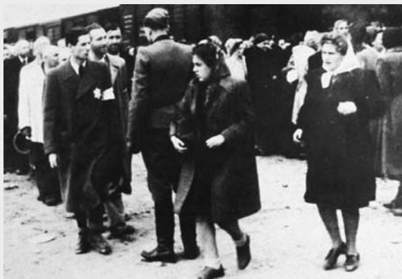
A szelekció folyamata: a munkára alkalmasak és alkalmatlanok kiválasztása...