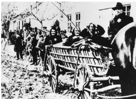
A vidéki zsidók gettósítása

A fontossági sorrendet számos katonai, politikai és pszichológiai tényezőt szem előtt tartva alakították ki. Lényeges volt az időtényező is, a Vörös Hadsereg gyors közeledése miatt. Politikai