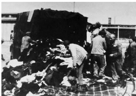
A zsákmány feldolgozása

kiszabott büntetésüket töltötték. Politikai számításoktól vezérelve, a kommunisták csúfot űztek a büntetőjogból.