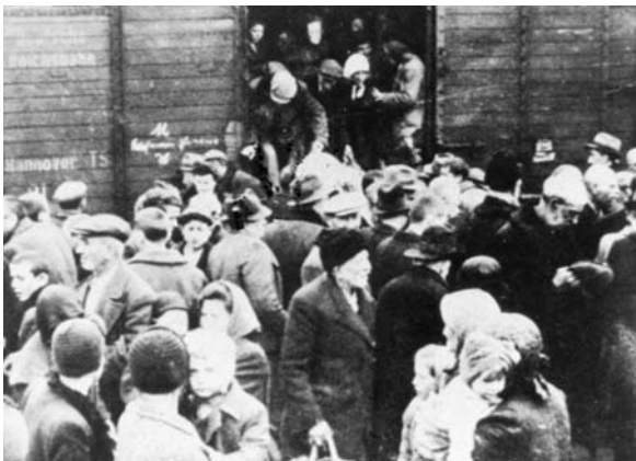
A vidéki zsidóság bevagionírozása és deportálása

ból a bevagionírozási állomásra vitték őket, valamennyiüket újból megmotozták. A motozások brutalitása változó volt, de mindenhol egyformán megalázó. Az átkutatások során a személyes iratokat, köztük a személyi igazolványokat, okleveleket, sőt katonai igazolványokat gyakran összetépték, így azok büszke tulajdonosai „személytelené” váltak. Nem sokkal ezután felfegyverzett csendőrök és rendőrök hajtották a zsidókat a bevagionírozási állomásokra. Miután a zsidókat meglehetősen kegyetlenséggel a tehervagonokba besúfolták, a kocsikat leláncolták és lelakatolták. A végleges megoldásért felelős német és magyar