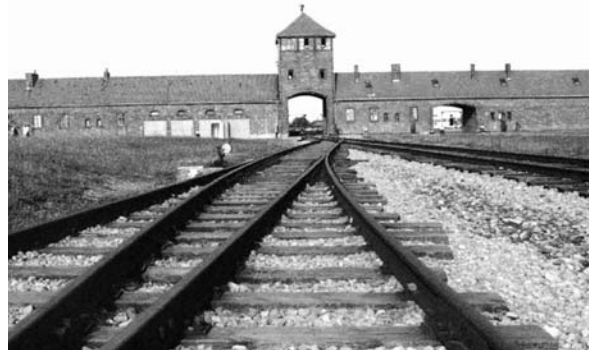
Auschwitz-Birkenau és a rámpáig vezető vasútvonal

A jelentések tanúsága szerint a művelet első két napján a deportált zsidók száma 23 363 volt. Május 18-ig elérte az 51 000-et. Ahogy múltak a napok, a deportáltak száma drasztikusan emelkedett: május 19. – 62 644; május 23. – 110 556; május 25. – 138 870; május 28. – 204 312; május 31. – 217 236; június 1. – 236 414; június 2. – 247 856; június 3. – 253 389 és június 8. – 289 357.