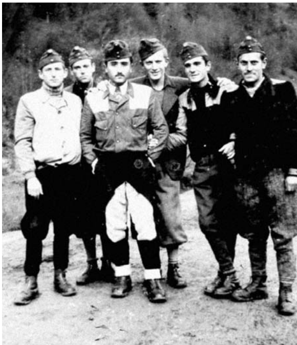
„Egyenruhás” zsidó munkaszolgálatosok bevonulásuk előtt