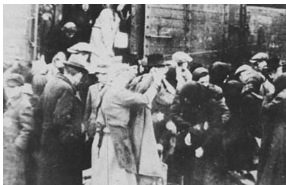
A bevonóirózás és deportálás

A zsidók „az utazásra” csak néhány személyes holmit vihettek magukkal. Szigorúan tilos volt készpénzt, ékszert vagy más értéktárgyat maguknál tartaniuk. Közvetlenül azelőtt, hogy a gettók-