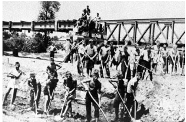
Zsidó munkaszolgálatosok különböző ukrainai munkahelyeken

Az észak-erdélyi zsidó közösség ugyancsak megszenvedte az 1941 nyarán a magyarországi hatóságok által életbe léptetett „idegenellenes” kampányt. Ez az intézkedés Észak-Erdély valamennyi vármegyéjét érintette, ám különösen a Máramaros és a Szatmár vármegyei közösségeket sújtotta, ahol meghatározhatatlan számú zsidót gyűjtöttek össze mint „idegent”. Ők a mintegy 16 000 – 18 000, Magyarország területéről Kamenyec-Podolszkij közelébe deportált zsidó közé tartoznak, akiknek többségét 1941. augusztus 27 – 28-án lemészárolták.