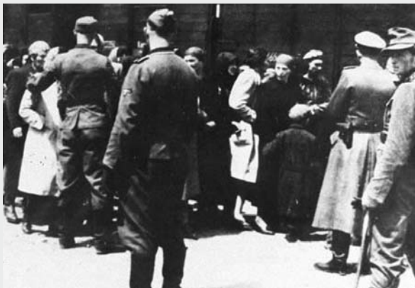
A tanulmány illusztrációi az Auschwitz Albumból valók. A képeken szereplő áldozatokat Magyarország akkori területéről deportálták.